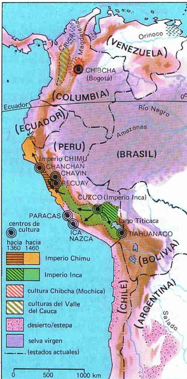
Culturas precolombinas en América del Sur

Mapa 2 (der): Expansión del Imperio Inca desde 1463 a 1525, bajo los reinados de Pachacútec (1438-71); Túpac Yupanqui (1471-93); y Huaina Cápac (1493-1525).