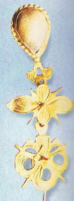
Arete de oro y perla