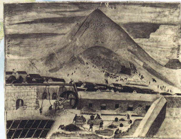
MINA DE PLATA EN POTOSÍ, PERÚ, CERCA DE 1584

SAN PEDRO ⑭ Este barco de guerra, con un tesoro de 800 mil dólares estalló en 1815 cerca de Caracas. Sus 500 tripulantes perecieron, pero gran parte del tesoro fue recuperado después.