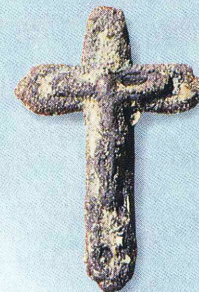
Crucifijo de plata y madera