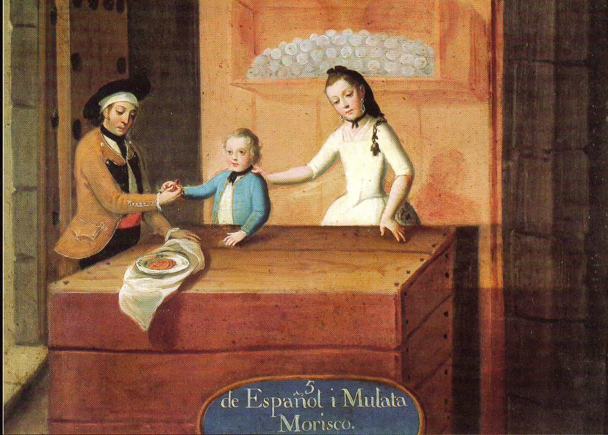
de Español i Mulata 5 Morisco.